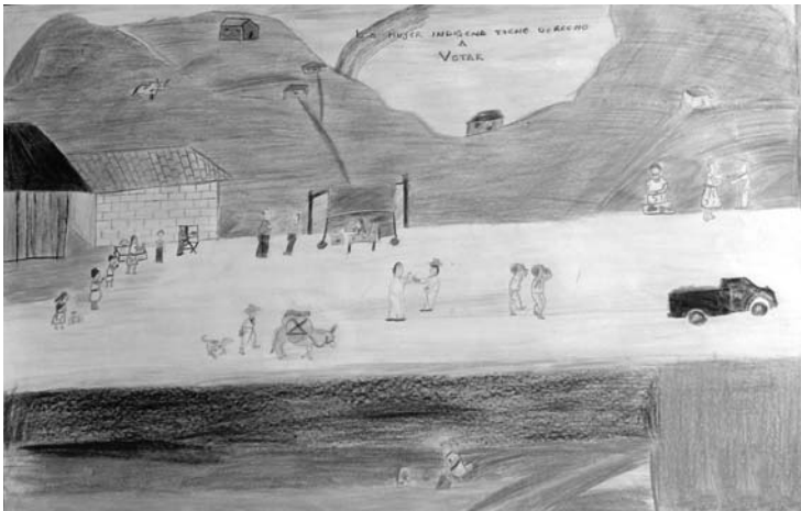
Tercer Lugar Autor: Adrián Vázquez Cabrera Título: La mujer indígena tiene derecho al voto Bachillerato General Octavio Paz

Concurso Estatal de Pintura: Así pintamos la democracia 2007