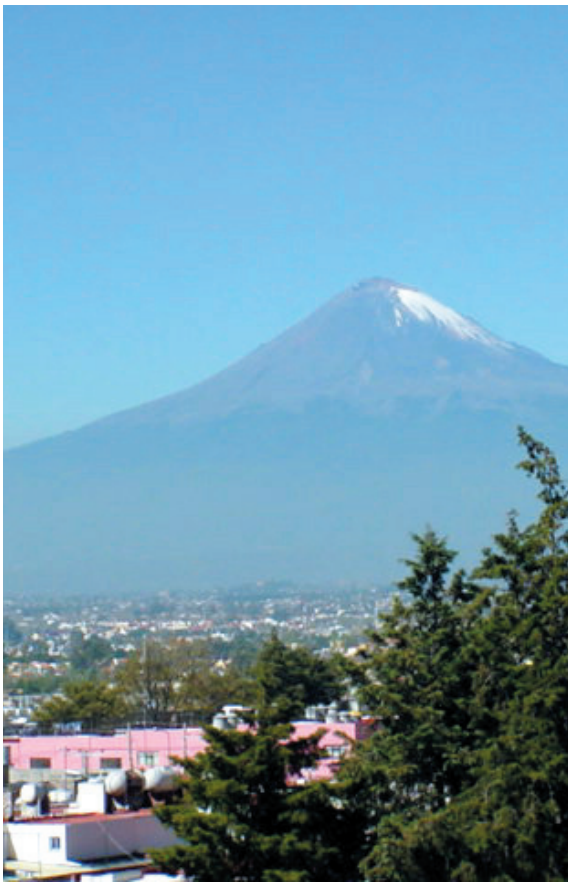
Volcán Popocatepetl.