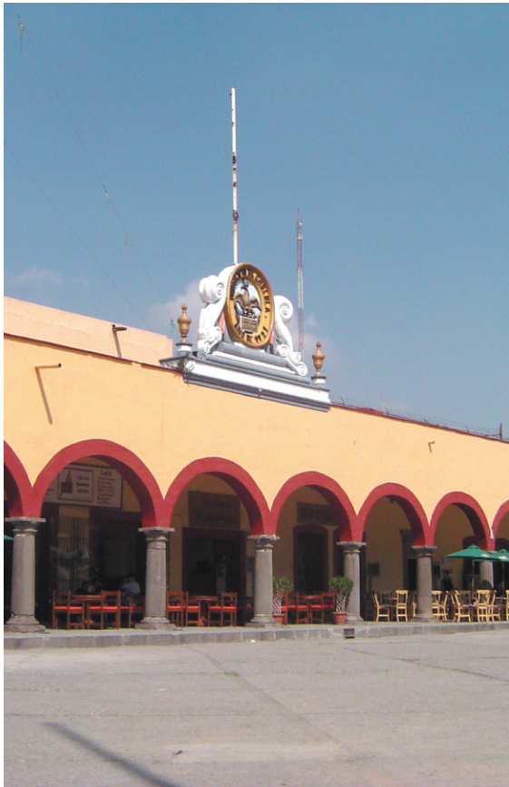
Cholula, Puebla.