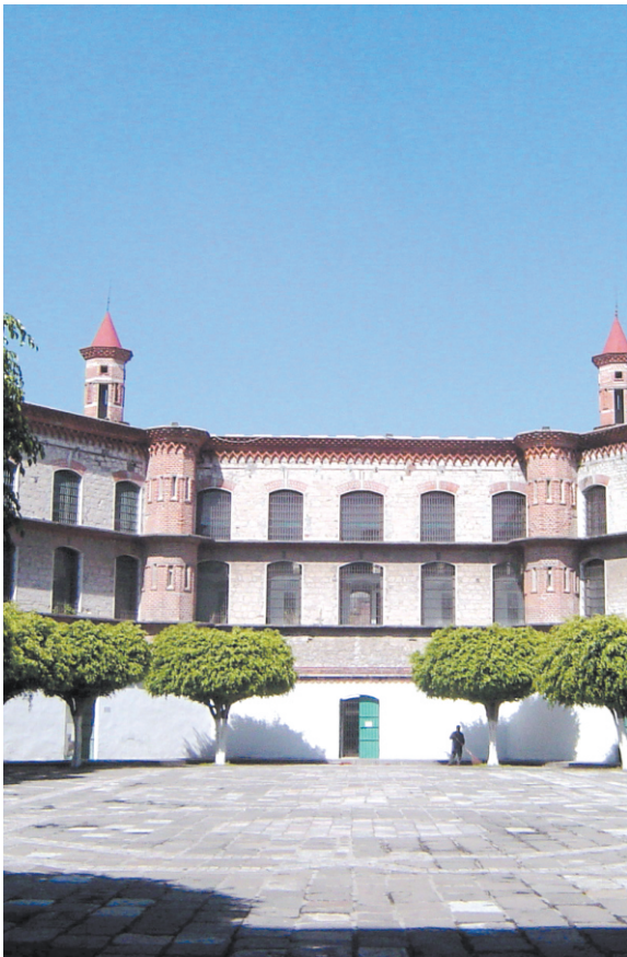
Centro Cultural Poblano.