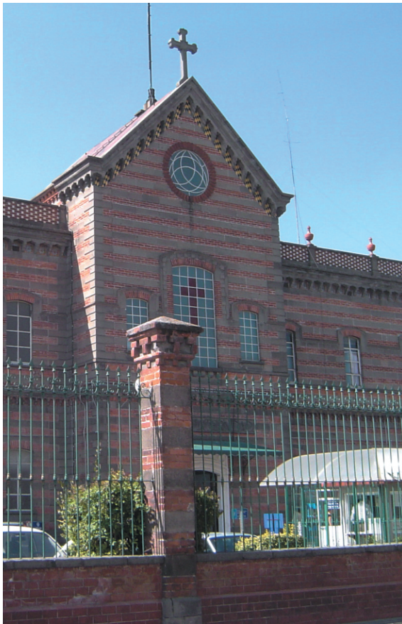
Hospital de la Universidad Popular Autónoma del Estado de Puebla (UPAEP).