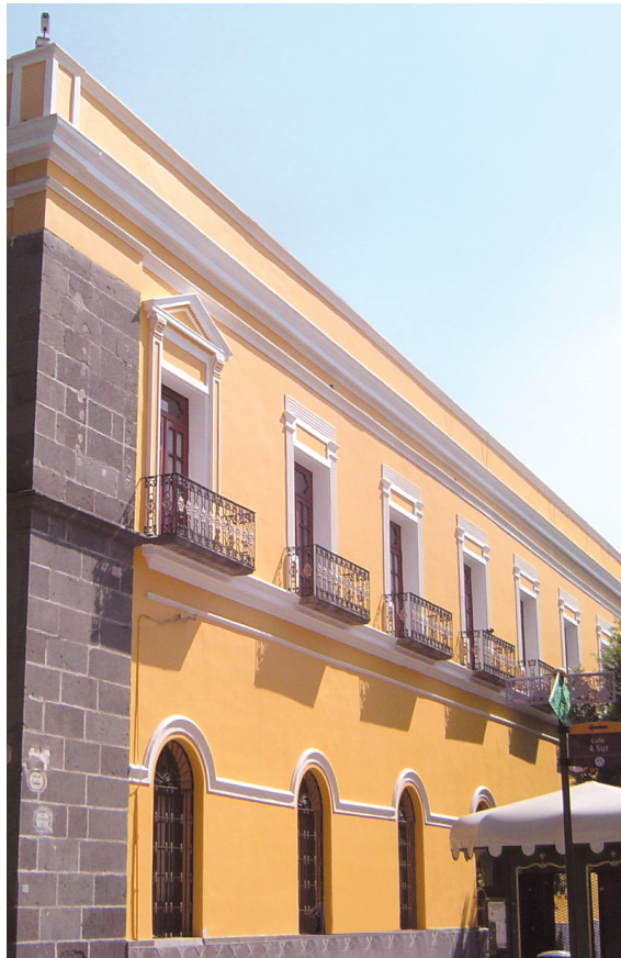
Edificio Carolino.