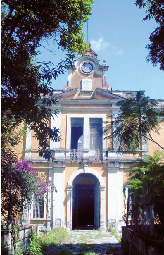
Ex fábrica Textil "La Constanacia"