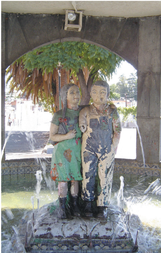
Fuente de los muñecos del Barrio de Xonaca, Puebla.