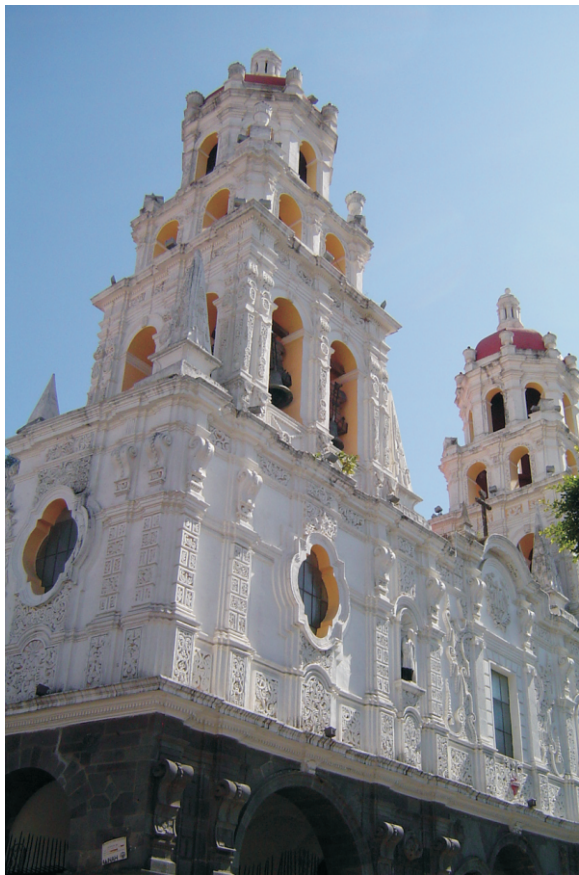
Iglesia de la Compañía de Jesús.