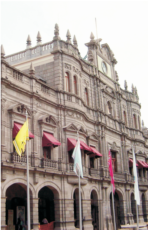
Palacio Municipal de Puebla.