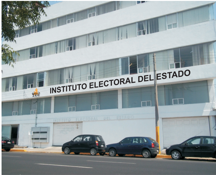
Instituto Electoral del Estado. Fotografía: José Felipe Juárez Navarro.